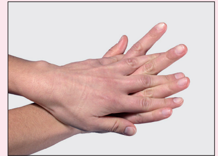
3. Handfläche über Handrücken mit gespreizten Fingern