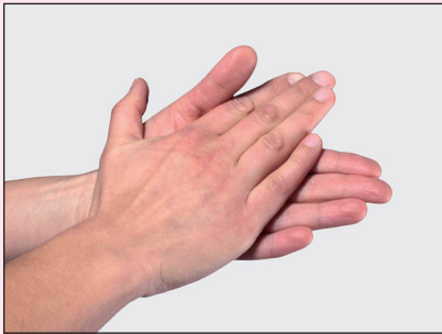
1. Handfläche auf Handfläche