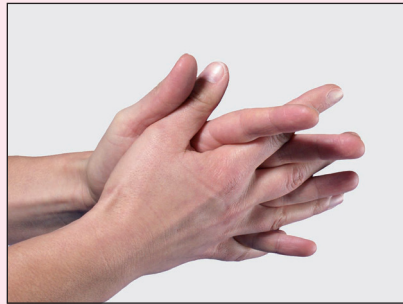
2. Handfläche auf Handfläche mit verschränkt gespreizten Fingern