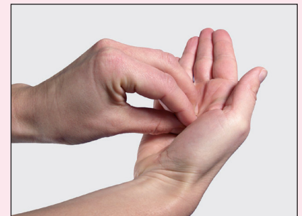
6. Fingerkuppen kreisförmig auf anderer Handfläche